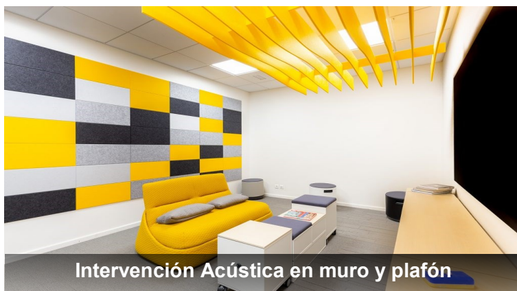
Intervención Acústica en muro y plafón

Ofreciendo una experiencia acústica Superior con un diseño Exclusivo y totalmente personalizado.