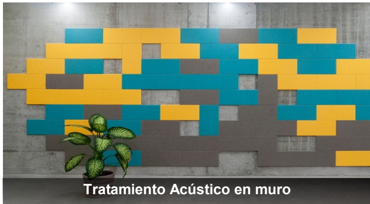
Tratamiento Acústico en muro