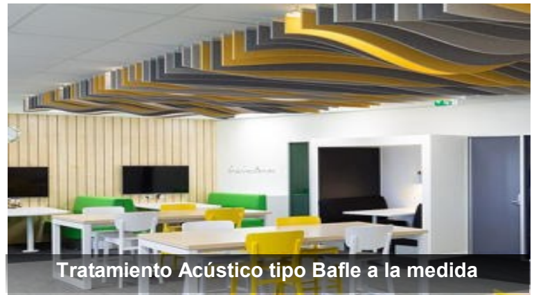
Tratamiento Acústico tipo Bafle a la medida