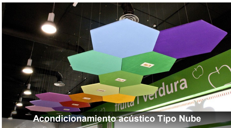
Acondicionamiento acústico Tipo Nube